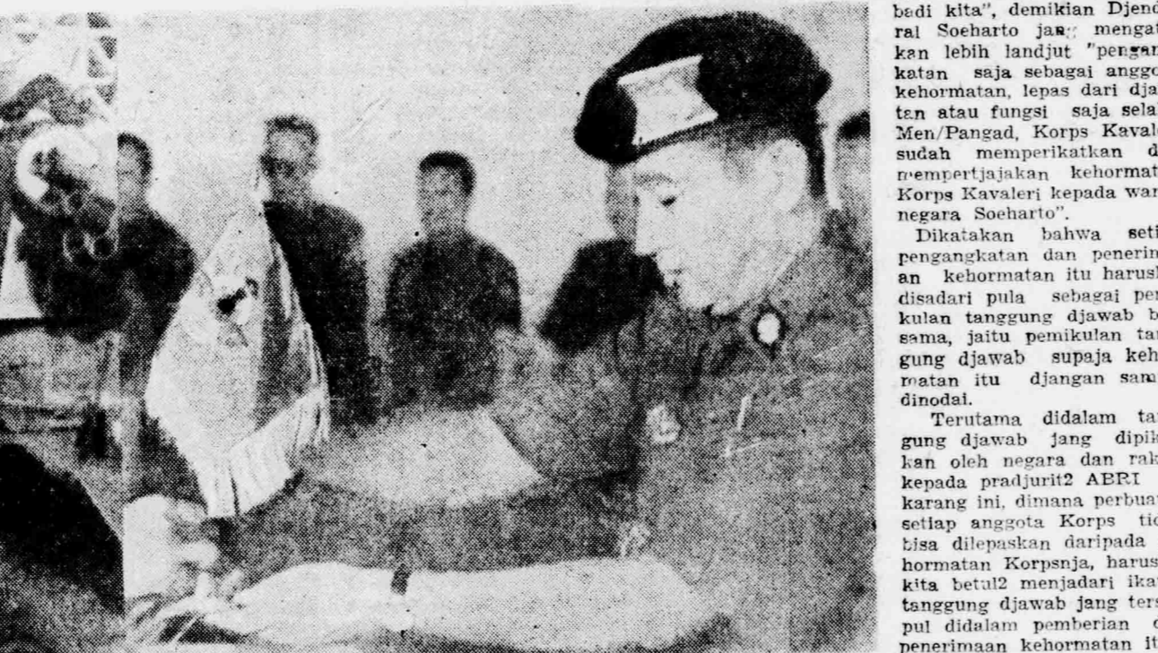
Djakarta, 8 Sept. (AB-06). MEN/Pangad Djenderal Suharto Rebo siang menjatakan dipedan rapat kerja Corps Kavaleri bahwa tugas dan tanggung jawab Corps Kavaleri yaitu memberikan salam yang sebesar-besarnya menurut tugas dan fungsinya sebagai pradirjut TNI/AD agar Dwi Dharma dan Tjatur Karya yang merupakan program Ka-